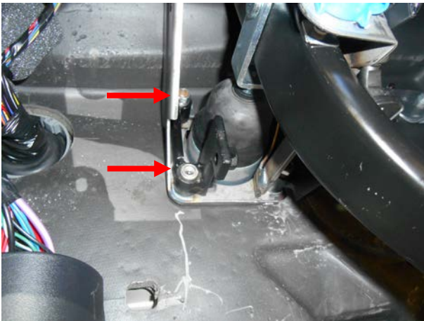
Притянуть нижний кронштейн 2-мя срывными гайками.