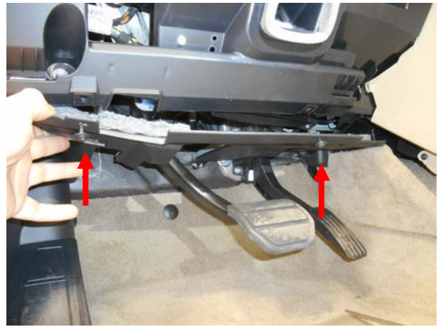
Вывернуть саморезы и снять панель.