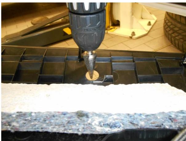
Разметить и выполнить отверстие в панели.

Проверить легкость перемещения ригеля и педали. Затянуть срывной крепеж.