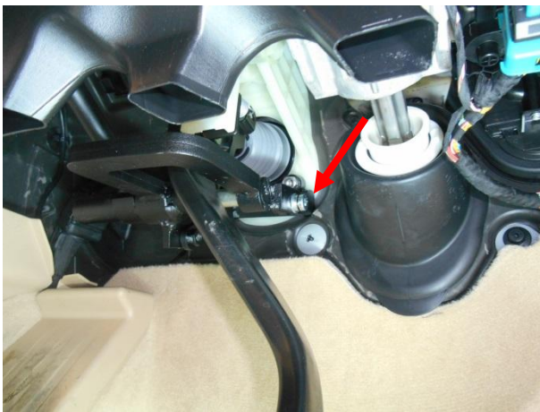
Притянуть замок к кронштейну срывным болтом.