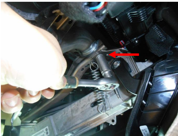
Отвернуть гайку крепления рулевой колонки.