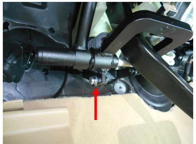
Притянуть замок к кронштейну срывным болтом.