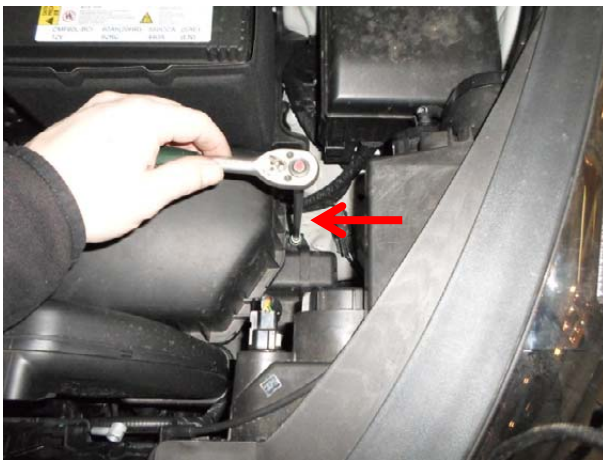
Вывернуть болт крепления воздушного фильтра.