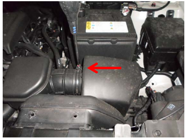
Ослабить крепление хомута воздушного патрубка.