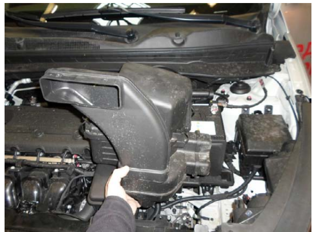
Снять воздушный фильтр.