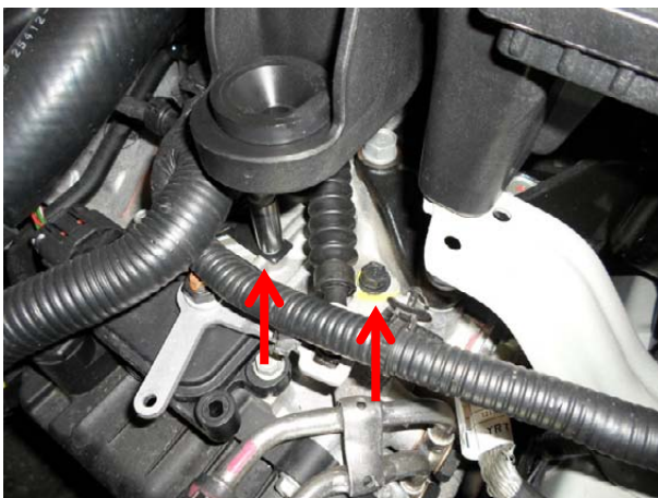
Вывернуть 2 болта.