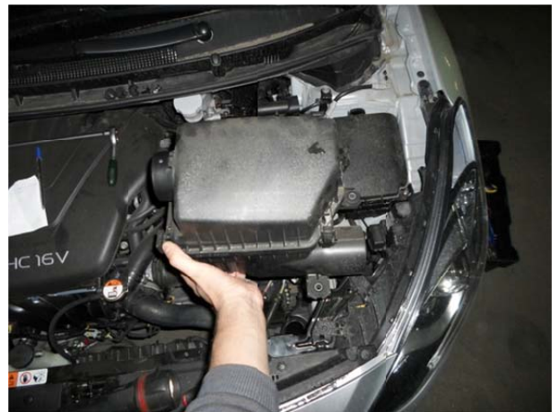
Вытащить корпус воздушного фильтра.