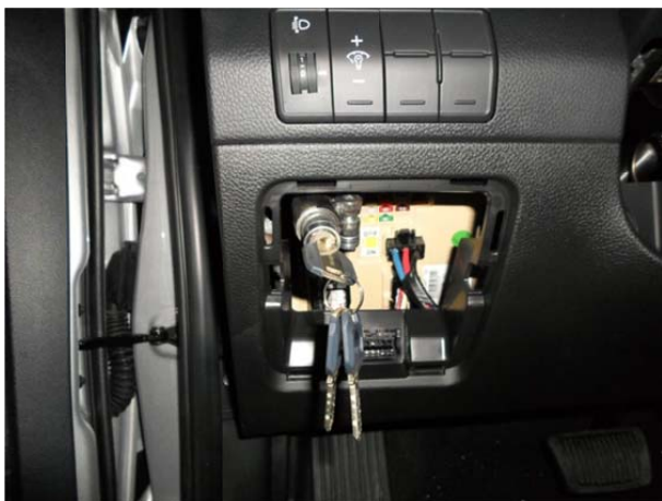
Одеть уплотнительное кольцо на оболочку. Установить замковый механизм в кронштейне, притянуть его срывным болтом М8х20. Поворотом замкового механизма добиться нулевого выступа ригеля из корпуса, проверить лёгкость работы замка.