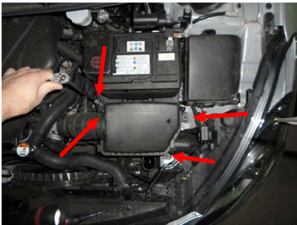
Ослабить хомут воздушного патрубка, вывернуть болты крепления корпуса воздушного фильтра.