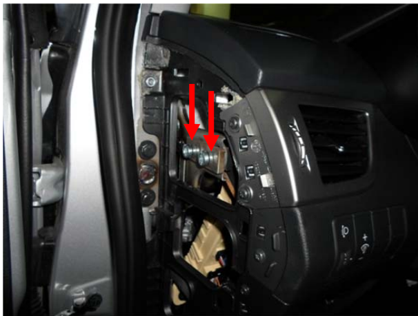
При установке кронштейна использовать пластину с втулками (крышка). Притянуть болтами М8х25.