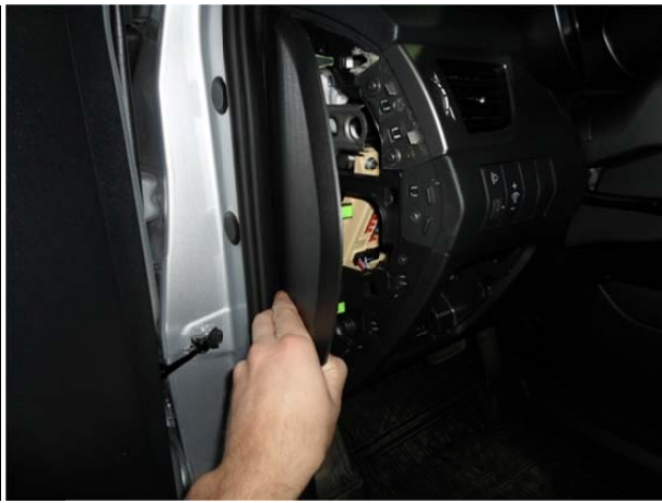
Снять боковую панель.