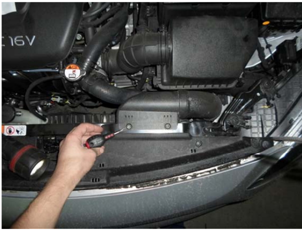
Выдернуть 2 клипсы воздухозаборника.