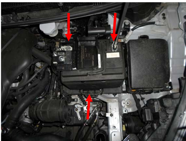
Открутить клеммы АКБ, ослабить болт крепления АКБ, вытащить АКБ.