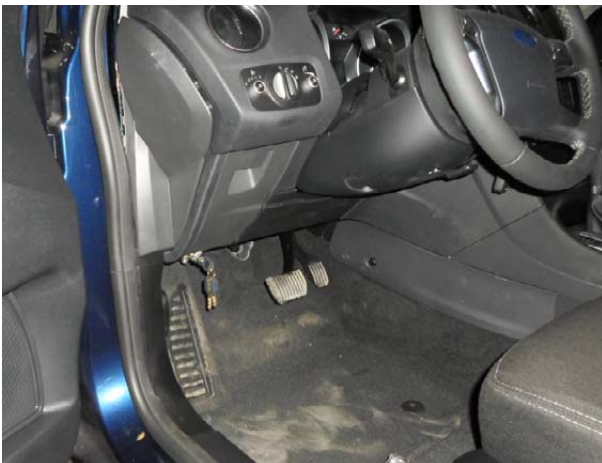
Затянуть срывные болты до отрыва головок.