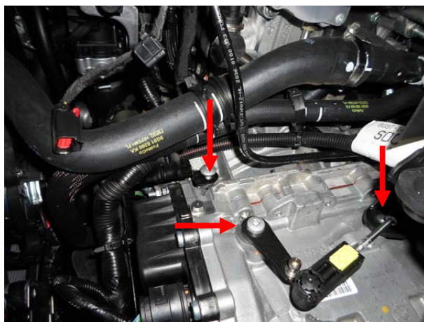
Выкрутить 2 болта, заменить винт крепления флажка на срывной.