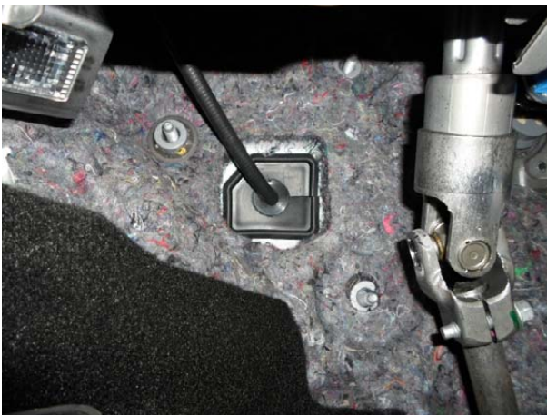
Вставить в отверстие в заглушке уплотнительное кольцо.