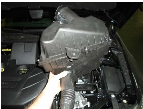
Снять воздушный фильтр.