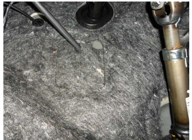
Разрезать шумоизоляцию под оболочку и установить на место