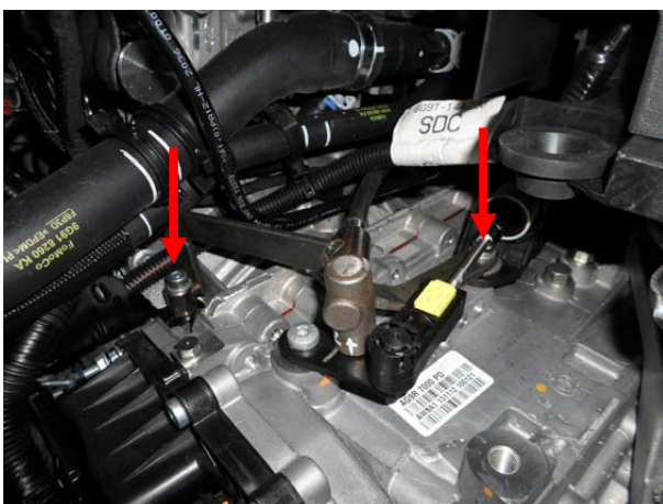
Установить замок, притянув срывными болтами.