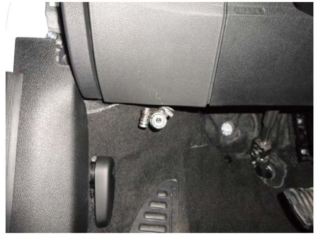
Провести оболочку с замковым механизмом в салон через отверстие в заглушке. Одеть уплотнительное кольцо на оболочку. Установить замковый механизм в кронштейне, притянуть его срывным болтом. Поворотом замкового механизма добиться нулевого выступа ригеля из корпуса, проверить лёгкость работы замка.