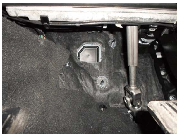
Вытащить шумоизоляцию, вытащить пластиковую заглушку.