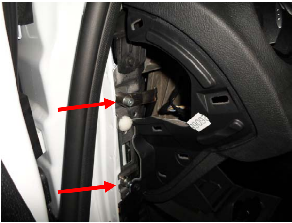
Притянуть кронштейн срывными болтами.