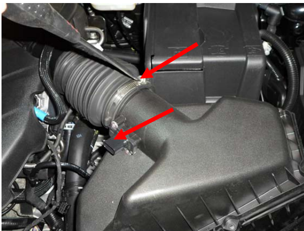
Ослабить хомут крепления воздушного фильтра, отсоединить разъем.