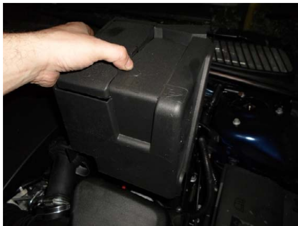
Снять крышку аккумуляторной батареи.