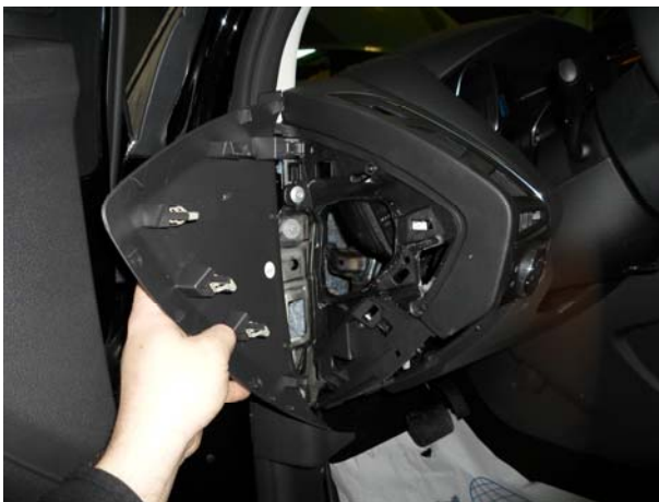
Снять боковую панель