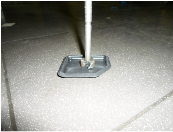
Выполнить отверстие в заглушке фрезой 20 мм, установить на место