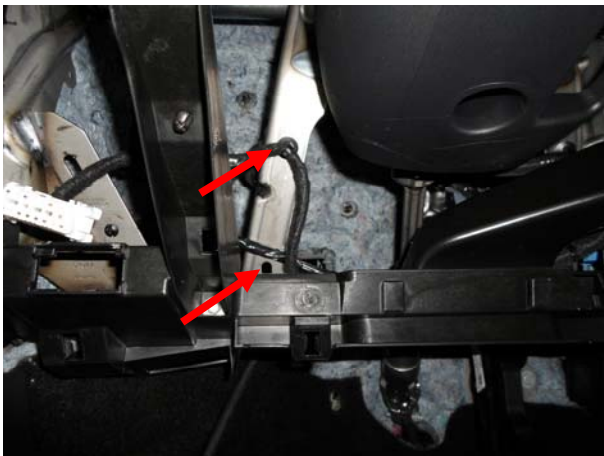
Освободить 2 отверстия