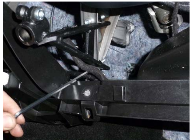
Установить кронштейн замкового механизма