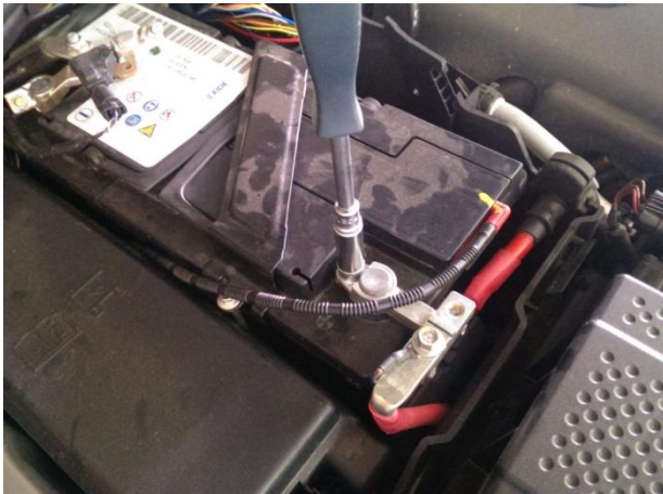
Ослабить болт. Снять клемму.