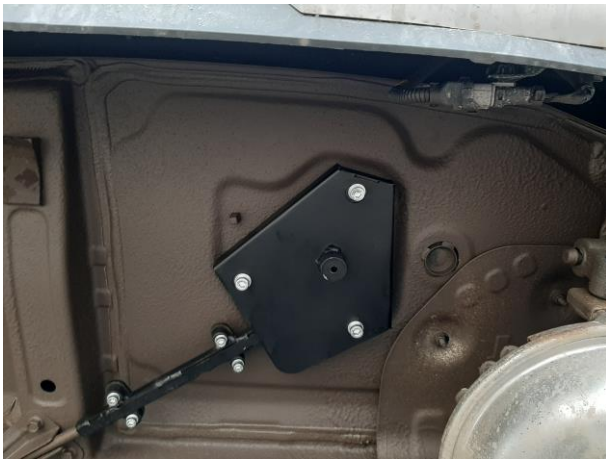
Установить основную защиту, притянуть болтами M8x50.