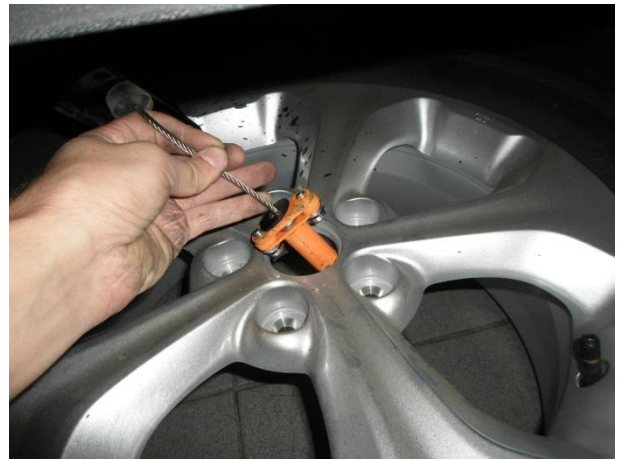
При установке запасного колеса вставляем защитный элемент. (в сборе)