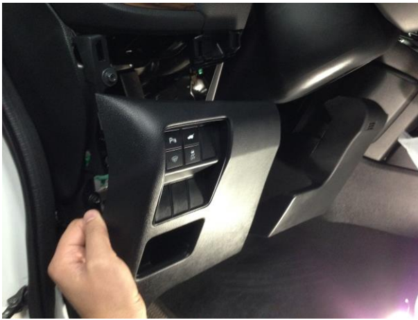
Снять панель, отсоединить фишки.