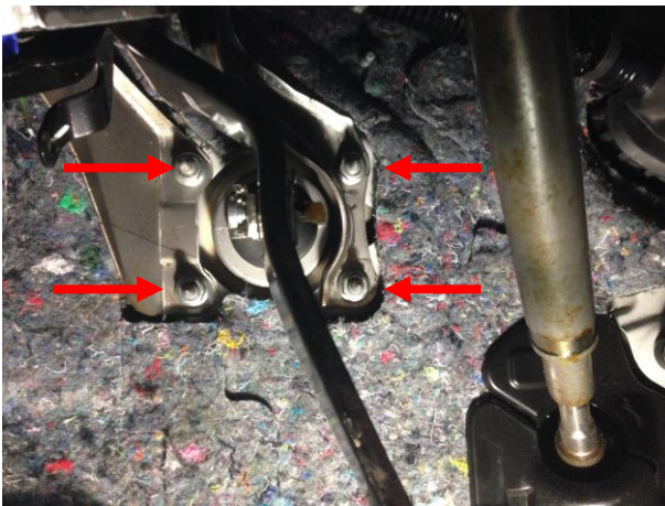
Открутить 4 гайки.