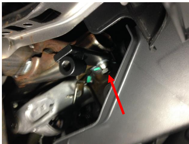
Притянуть верхнее крепление замка.