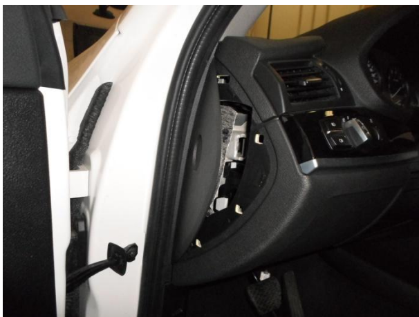
Снять боковую панель.