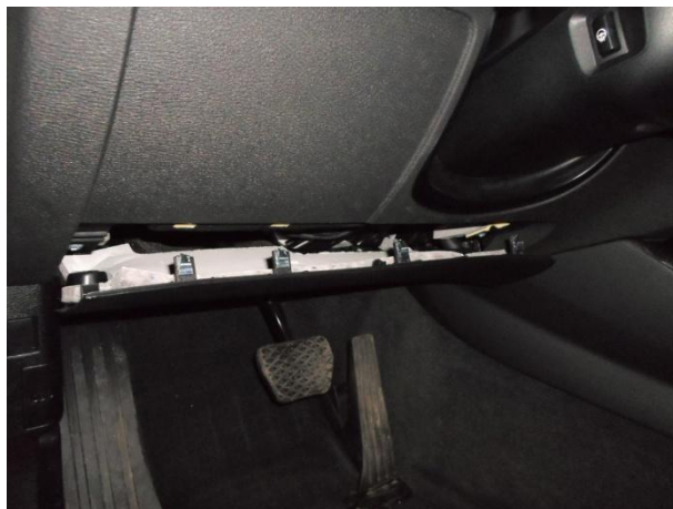
Снять панель, отсоединить фишки.