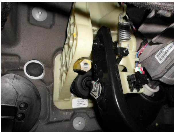
... и заменить ее шестигранником L-120 мм.