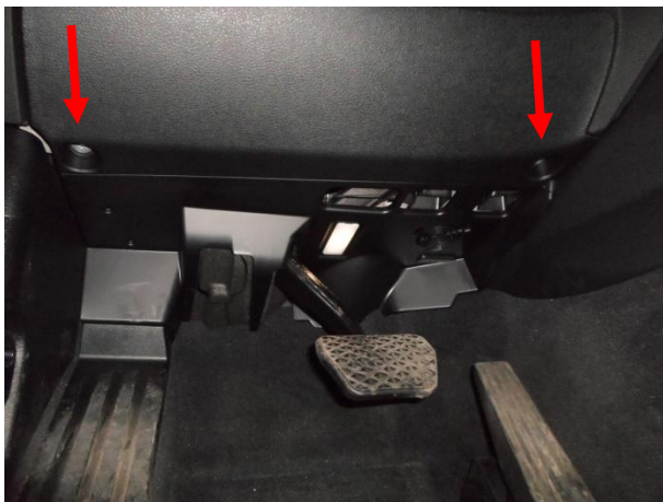
Вывернуть два самореза.