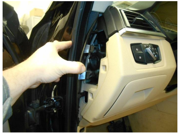
Снять боковину панели.