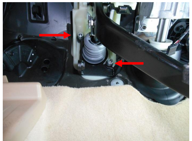
Вывернуть болты крепления вакуумного усилителя и установить кронштейн, затянув срывными гайками.