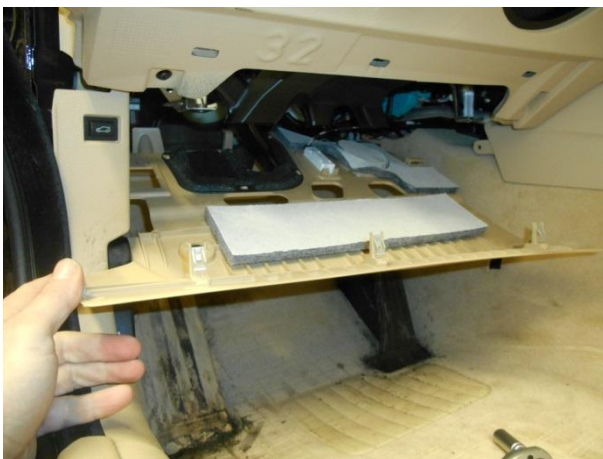
Отсоединить фишки, снять панель.