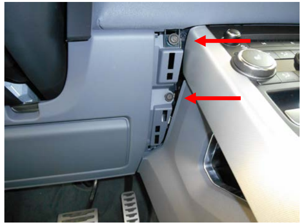
Выкрутить 2 винта и отвести панель в сторону.