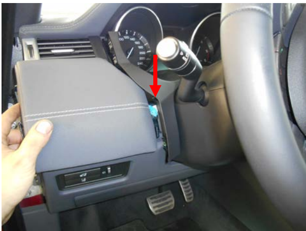
Выкрутить винт крепления панели и снять ее.