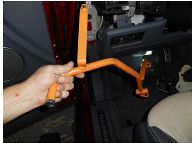
Завести блокиратор за панель приборов.