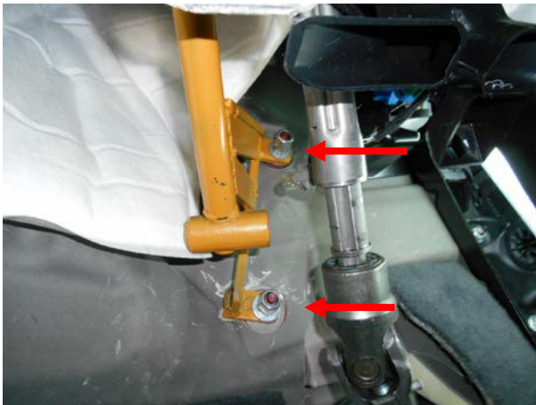
Притянуть нижнее крепление блокиратора.