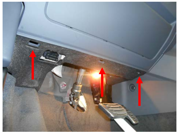
Вытащить клипсы и снять нижнюю панель над педалями.