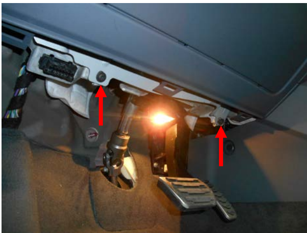
Выкрутить 2 винта.