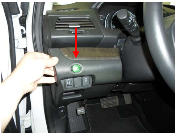
Снять малую боковую панель, отсоединить разъем кнопки.