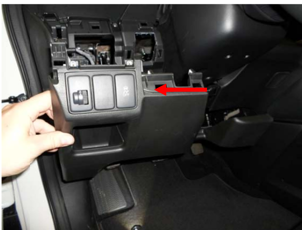
Снять левую большую боковую панель, отсоединить разъем кнопок.