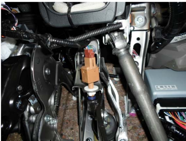
Снять датчик нажатия педали тормоза.