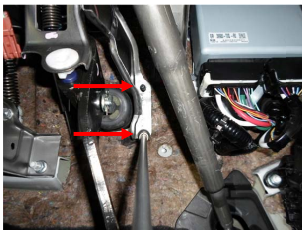
Выкрутить 2 гайки крепления каркаса педали тормоза.