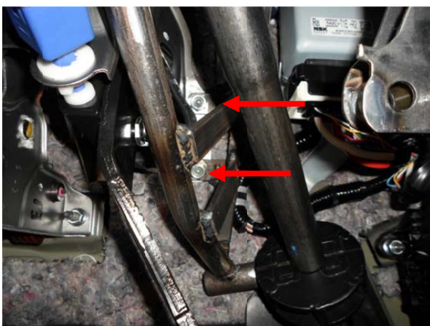
Притянуть нижнее крепление замка.