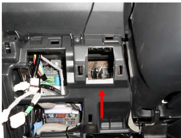
Выполнить окно в каркасе панели приборов.