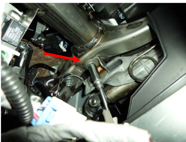
Выкрутить болт крепления рулевой колонки.