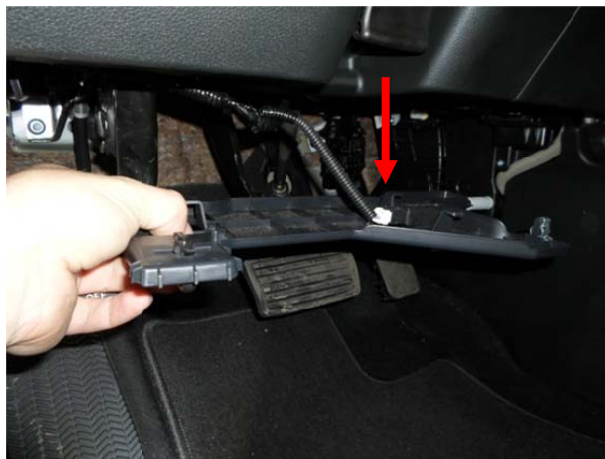
Снять нижнюю панель над педалями, отсоединить разъем лампы.