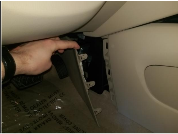
Выдернуть боковую панель, с другой стороны аналогично.