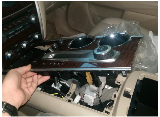
Снять центральную панель.