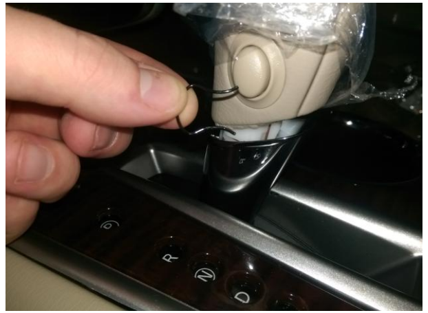
Вынуть фиксатор рычага.