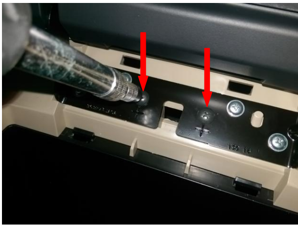
Вывернуть 2 самореза.