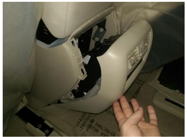
Снять заднюю панель.