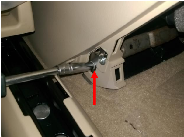
Вывернуть болт, с другой стороны аналогично.