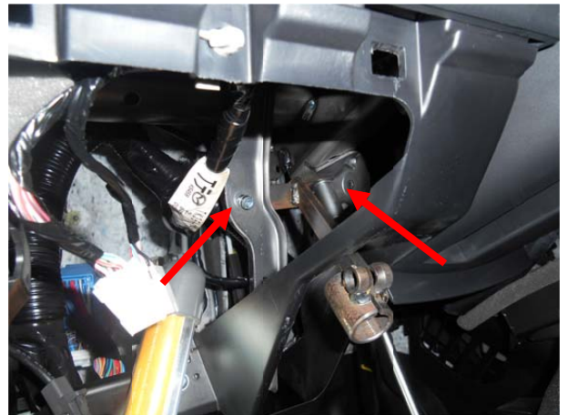
Установить кронштейн, притянув срывным болтом и гайкой.