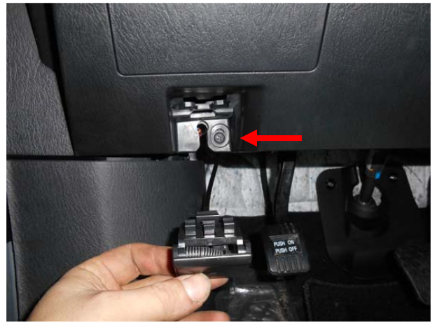
Снять ручку, выкрутить саморез.