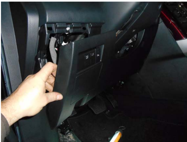
Отвести в сторону панель.