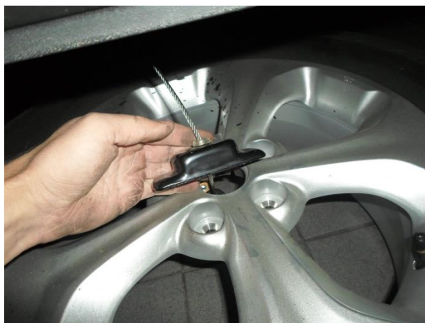
Затем держатель колеса.