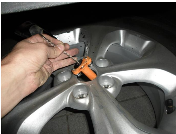
При установке запасного колеса вставляем защитный элемент. (в сборе)