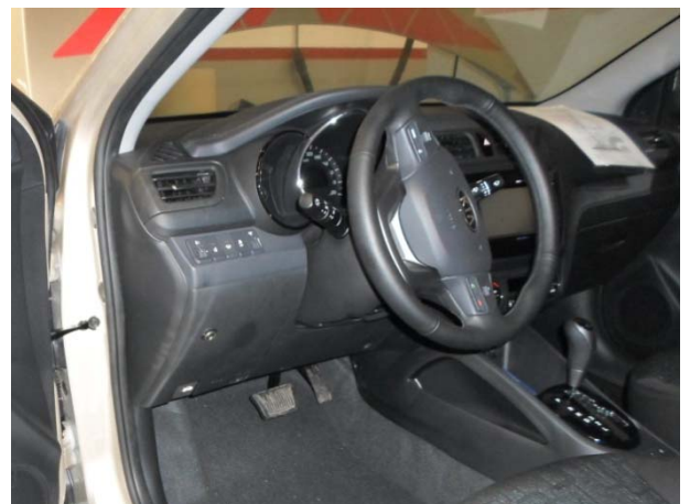
Затянуть срывные болты до отрыва головок. Установить на место крышку предохранителей, одеть декоративную накладку.