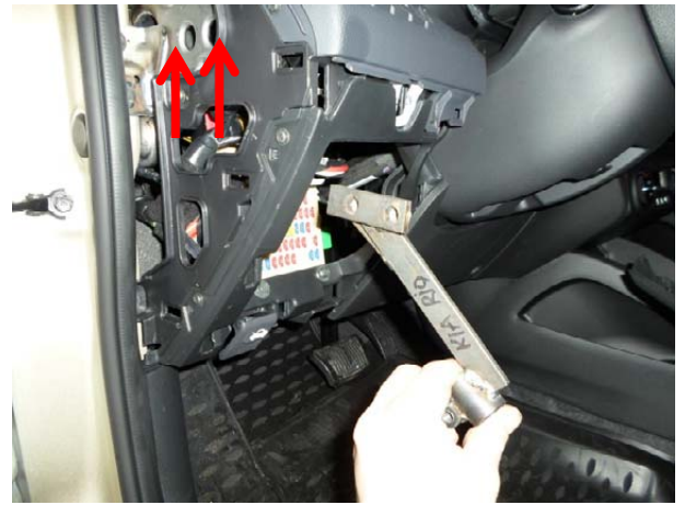
Установить кронштейн совместно с его крышкой и притянуть срывными болтами.