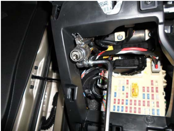
Вставить в кронштейн замковый механизм, притянув его срывным болтом. Поворотом замкового механизма добиться нулевого выступа ригеля из корпуса, проверить лёгкость работы замка. Одеть метку и разметить крышку предохранителей.