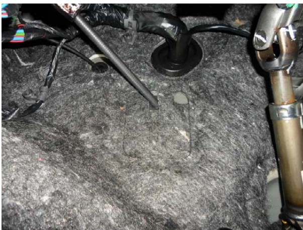
Установить в отверстие в моторном щите уплотнительное кольцо, вернуть на место шумоизоляцию.