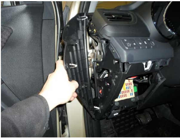
Снять боковую панель.