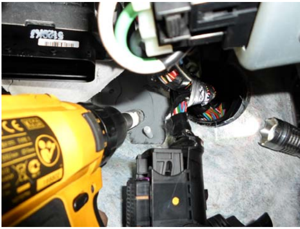
Выполнить отверстие в моторном щите