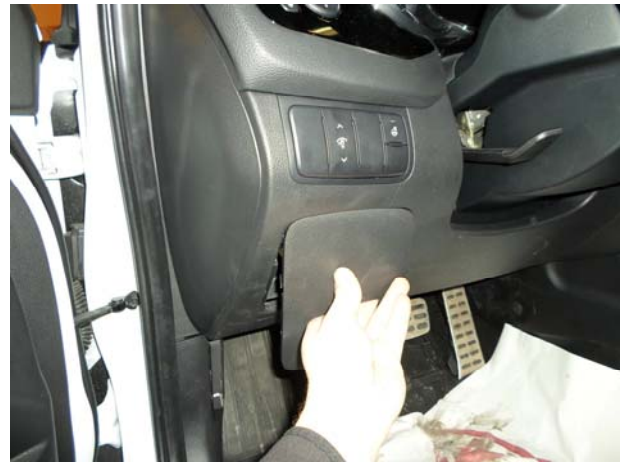
Снять крышку блока предохранителей