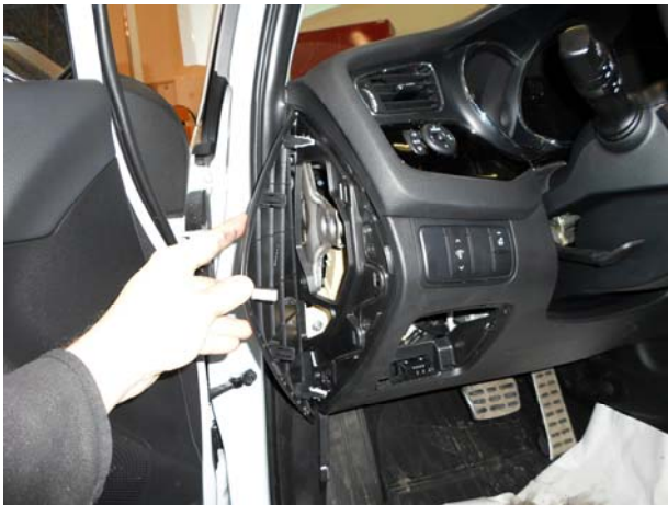
Снять боковую панель