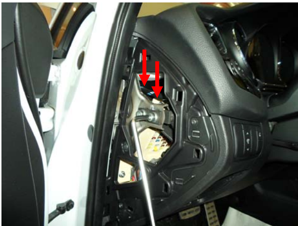
Притянуть кронштейн срывными болтами