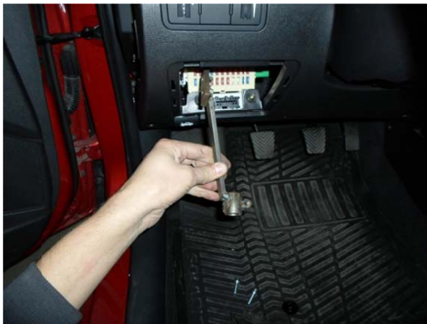
Установить кронштейн замка.