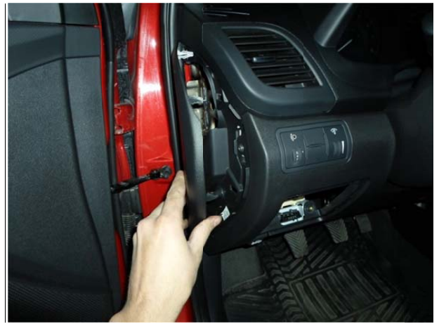
Снять боковую панель.