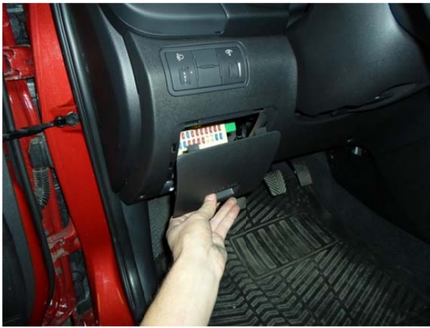
Снять крышку блока предохранителей.