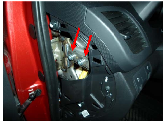
Притянуть его болтами М8х25 используя пластину с втулками (крышка).