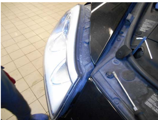
Выдвинуть фару вперёд.