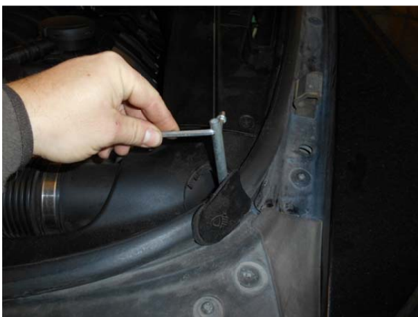
Используя штатный ключ, находящийся в багажнике, освободить фиксатор фары.