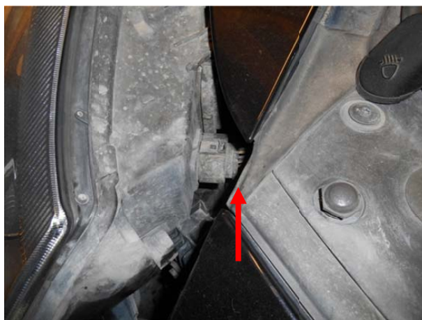
Отсоединить колодку и снять фару.