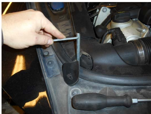
Используя штатный ключ, находящийся в багажнике, освободить фиксатор фары.