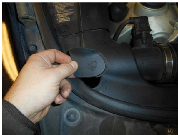
Открыть крышку штатного фиксатора фары.