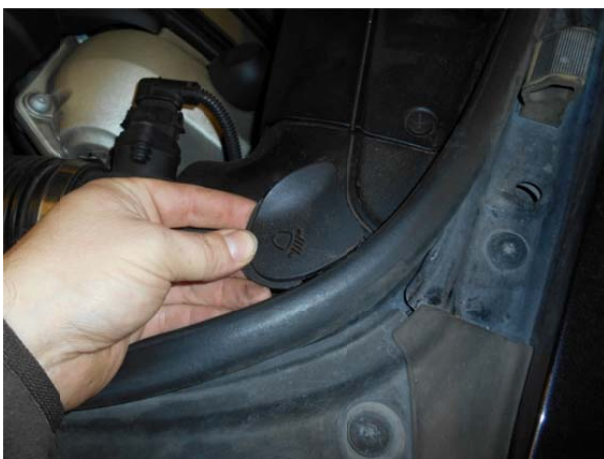
Открыть крышку штатного фиксатора фары.