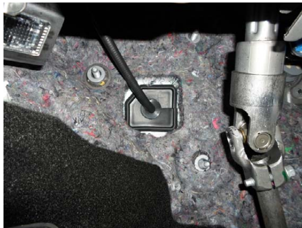
Вставить в отверстие в заглушке уплотнительное кольцо