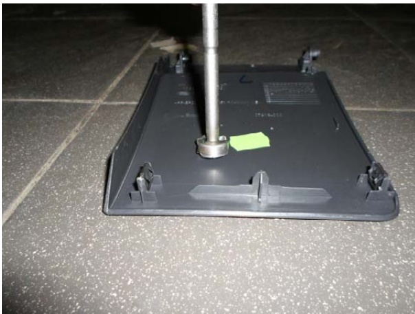
Выполнить отверстие в крышке диагностического разъёма