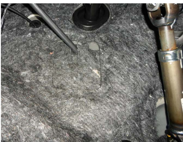
Разрезать шумоизоляцию под оболочку и установить на место