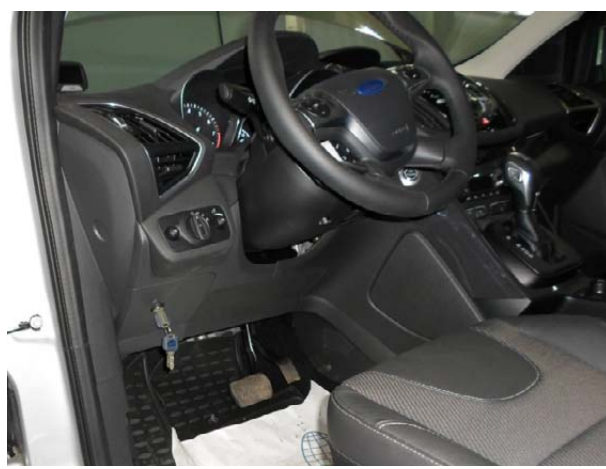
Затянуть срывные болты до отрыва головок. Установить на место крышку предохранителей, одеть декоративную накладку.