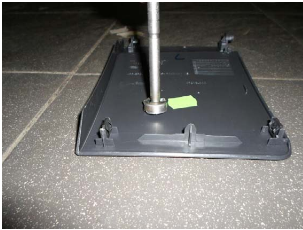
Выполнить отверстие в крышке диагностического разъёма