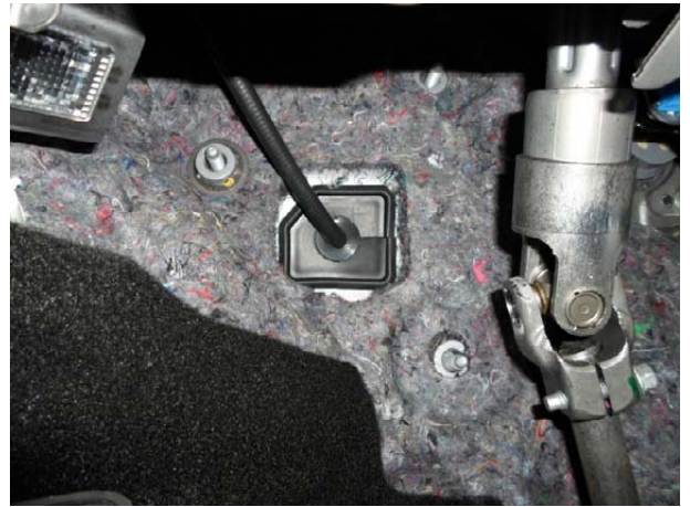
Вставить в отверстие в заглушке уплотнительное кольцо