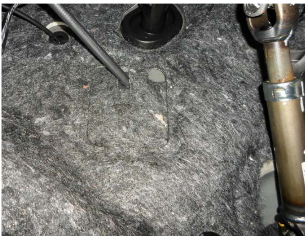
Разрезать шумоизоляцию под оболочку и установить на место