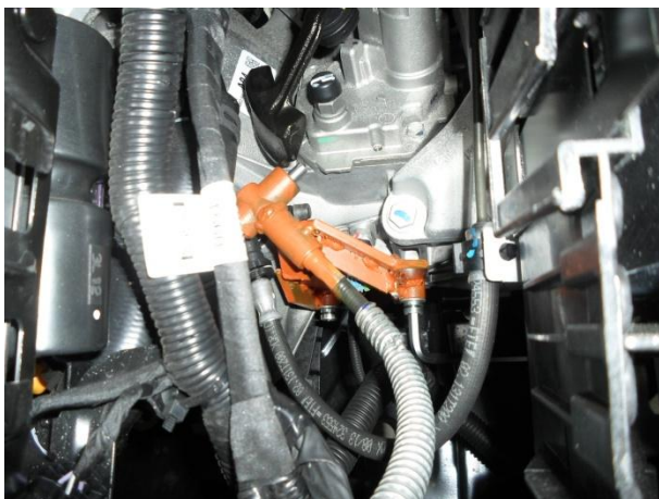
Установить блокиратор, притянуть болтами M10x40