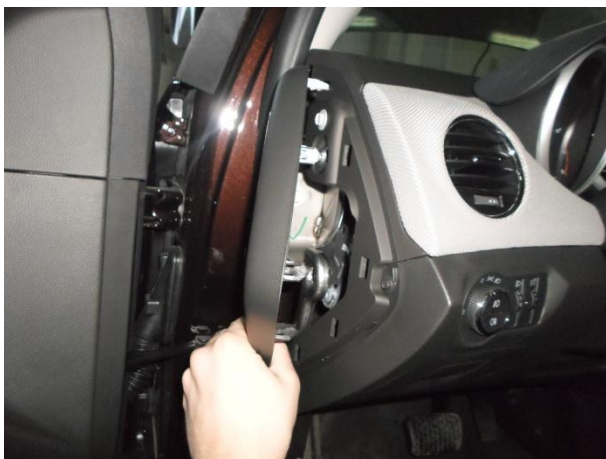
Снять боковую панель.