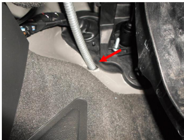
Выполнить отверстие в моторном щите, протянуть оболочку с замковым механизмом.